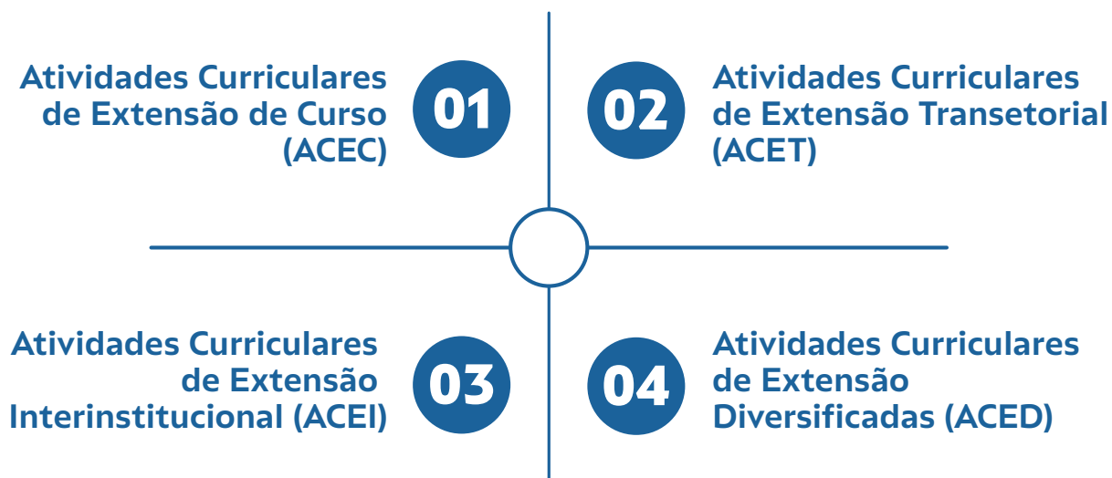
Figura 04 • Classificação da ACE na UFRPE

Como observado, a inserção curricular da extensão contribui para a consolidação da indissociabilidade entre ensino, pesquisa e extensão, além de assegurar a dimensão acadêmica da extensão na formação dos(das) estudantes. Nesses termos, a UFRPE classificou a Atividade Curricular de Extensão (ACE) em quatro tipos: