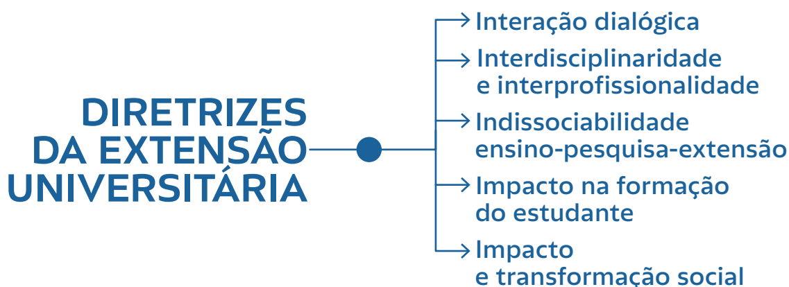
Figura 01 • Diretrizes da Extensão Universitária (os 5 “Is” da Extensão) | Fonte: elaboração dos autores

Nesse sentido, entende-se que a extensão universitária é uma dimensão formativa importantíssima para a qualidade da formação acadêmica que busca uma educação universitária socialmente contextualizada, inclusive nas ações conjuntas da graduação e pós-graduação, sendo imprescindível que se reconheça a epistemologia que a sustenta. Afinal, a extensão universitária não consiste em um praticismo, mas em uma prática sustentada em um campo teórico investigativo e questionador da realidade. Dessa maneira as diretrizes da extensão universitária 6 orientam a formulação e a implementação de ações de extensão em sociedade, numa perspectiva ampla e aberta.