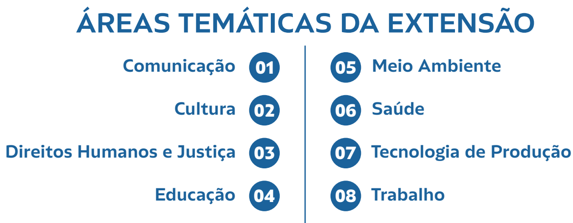
Figura 02 • Áreas Temáticas da Extensão | Fonte: elaboração dos autores

As ações de extensão são classificadas em oito áreas temáticas 9